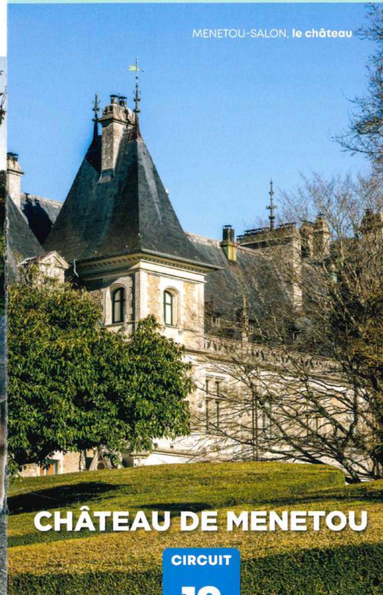
MENETOU-SALON, le château