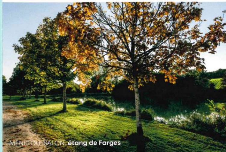
MENETOU-SALON, étang de Farges