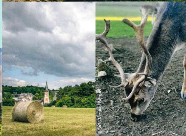
MENETOU-SALON, point de vue et rencontres aux alentours du château