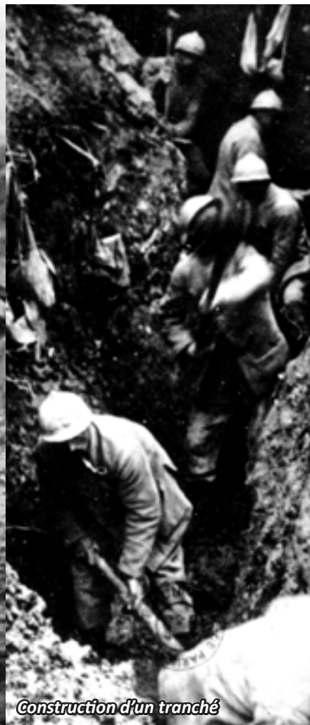
Construction d'un tranché