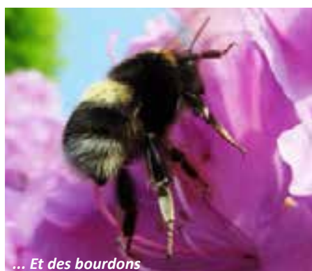
... Et des bourdons