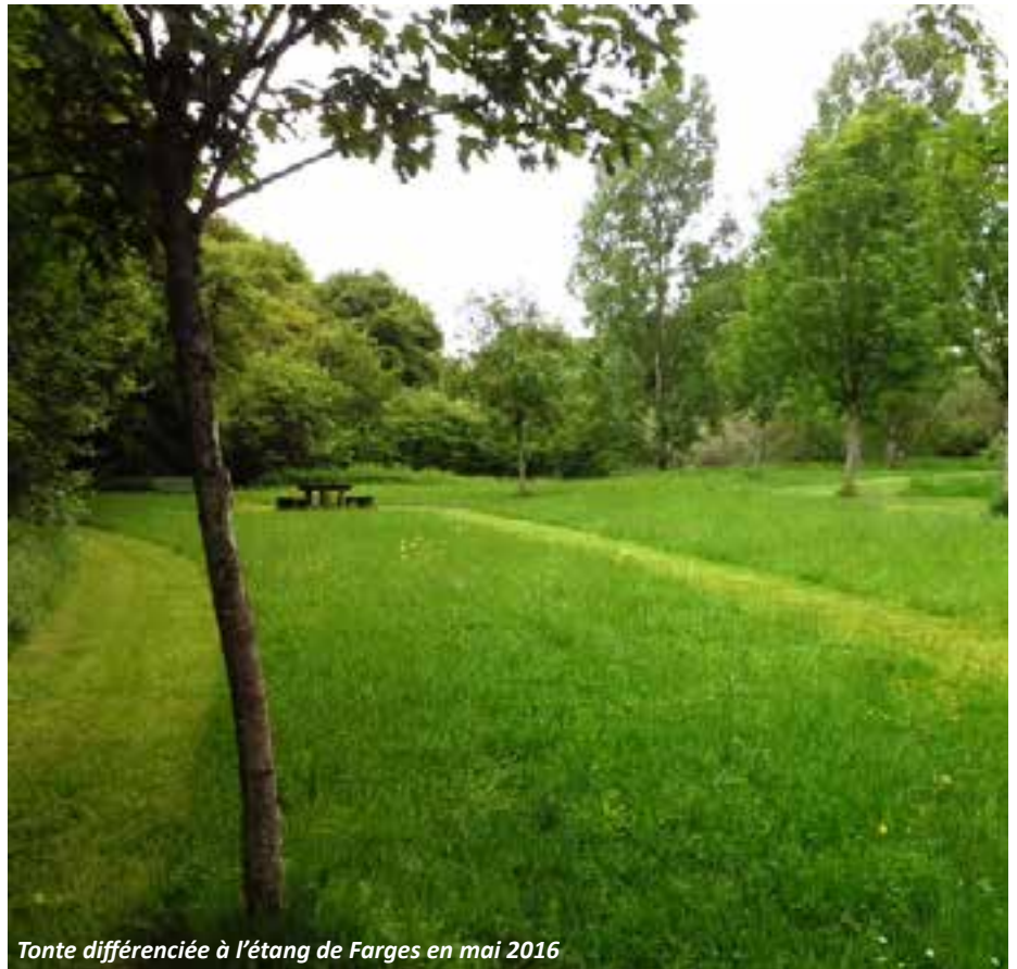
Tonte différenciée à l'étang de Farges en mai 2016

Certains aménagements, comme l'engazonnement des trottoirs, mettront du temps à s'installer et changeront en fonction des saisons.