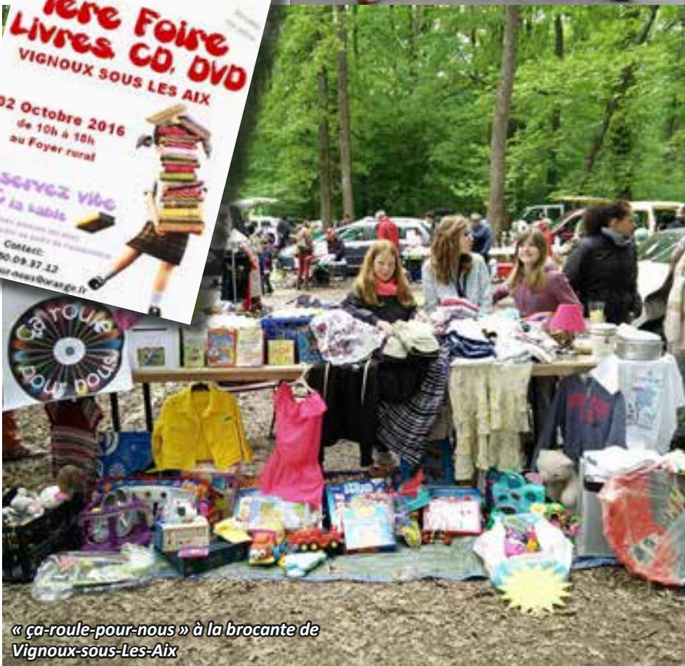
« ça-roule-pour-nous » à la brocante de Vignoux-sous-Les-Aix