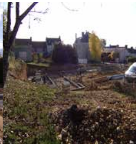
Puis vient l'heure du terrassement. La pose des premiers parpaings. Nous sommes début novembre.