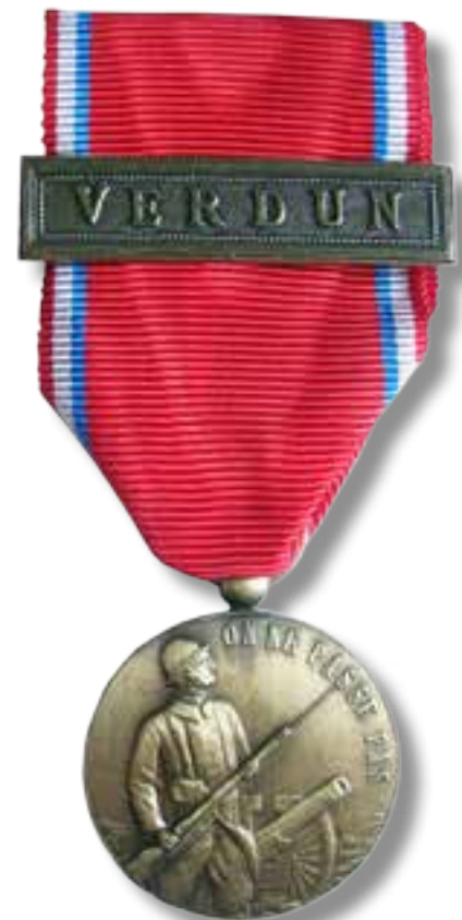
Médaille de Verdun*

* Cette médaille fut attribuée à chacun des combattants ayant pris part à la bataille de Verdun