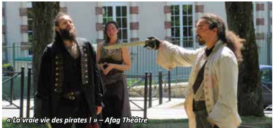
« La vraie vie des pirates ! » – Afag Théâtre