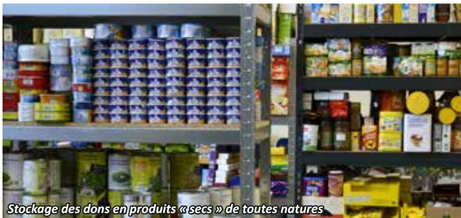
Stockage des dons en produits « secs » de toutes natures

foyers, représentant environ quatre vingt dix personnes, sont ainsi aidés pour des durées variables, en fonction de leur situation dont un nombre proportionnellement très important dans notre commune.