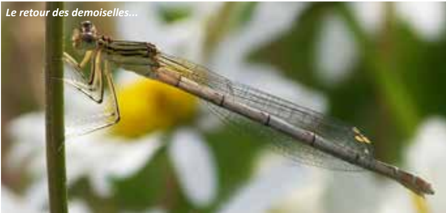
Le retour des demoiselles...