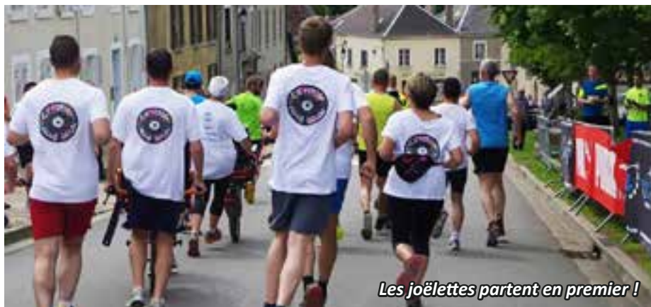
Les joëlettes partent en premier !

« À Menetou, en joëlette 2 , on dépasse les coureurs à pied ! »