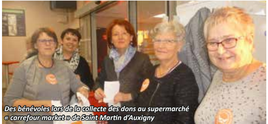
Des bénévoles lors de la collecte des dons au supermarché « carrefour market » de Saint Martin d'Auxigny