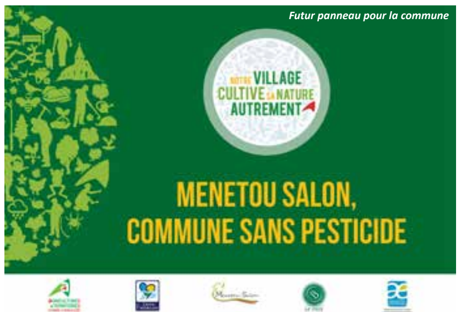
Futur panneau pour la commune