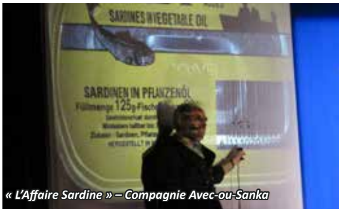
« L'Affaire Sardine » – Compagnie Avec-ou-Sanka

Depuis l'an dernier, la manifestation « Brins de Cultures » organisée par l'équipe de la Communauté de communes en Terres Vives (C.C.T.V.) est un ensemble de rendez-vous culturels accessibles à tous,