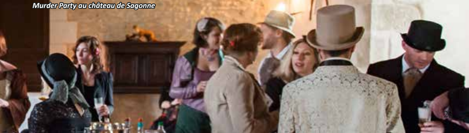
Murder Party au château de Sagonne