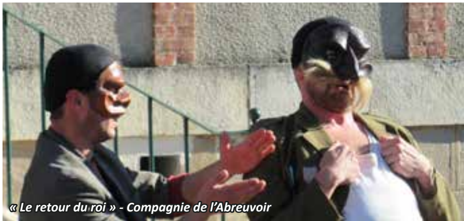
« Le retour du roi » - Compagnie de l'Abreuvoir