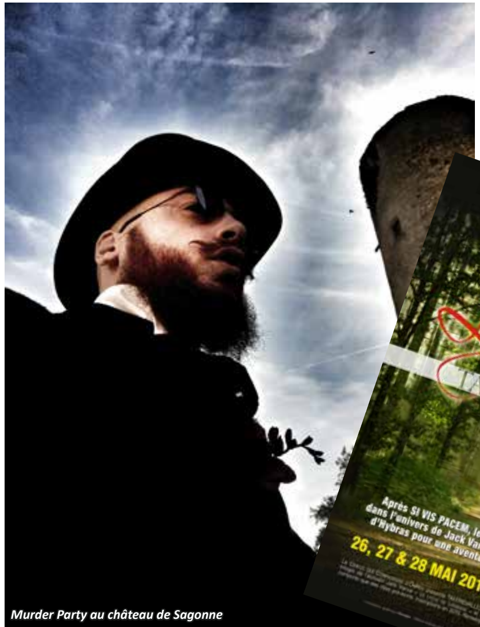
Murder Party au château de Sagonne

Rapidement, l'association organisa régulièrement des soirées jeux destinées aux Monestrosaloniens et aux autres ; ce sont les Nuits du Jeu de Rôles. Ensuite, grâce à un parisien exilé, nous avons découvert le jeu « Grandeur-Nature - ou G.N. » qui lance les joueurs costumés en immersion le temps d'un week-end. Dès 1994, en devenant organisateurs de ce type d'événement, nous sommes entrés dans la cour des grands. La même année, nous fûmes embarqués dans la création de ce qui deviendra la