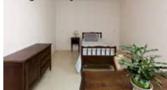
Aménagements (cuisine, télévision) dans les appartements réservés à l'hébergement temporaire