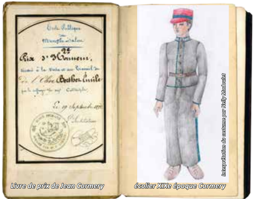
Livre de prix de Jean Cormery

Il ressentait très fort l'ardente obligation de répandre l'instruction dans toutes les couches de la société. C'est, disait-il, « le seul chemin de tout progrès, de toute civilisation ».