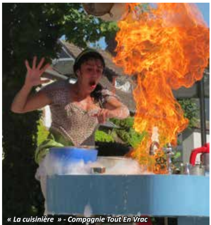
« La cuisinière » - Compagnie Tout En Vrac

Cette belle et chaude après-midi a commencé sous les frondaisons de la place du Haut par « La vraie vie des pirates ! » par la compagnie Afag (Au fond à gauche), troupe théâtrale qui nous avait déjà régalingés l'année précédente avec son histoire revisitée des Trois