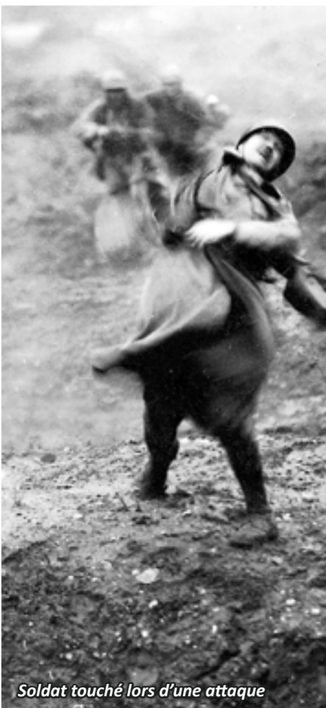
Soldat touché lors d'une attaque