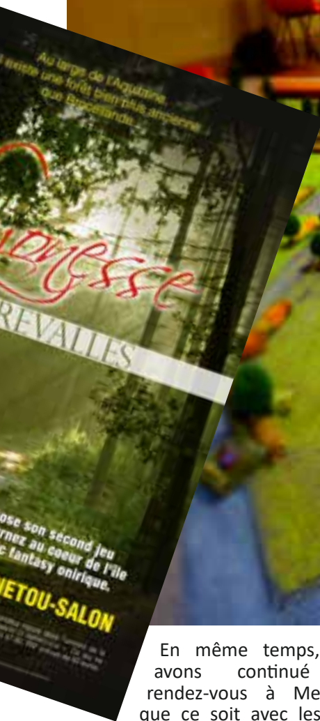
Nuit du Jeu à Menetou-Salon

Nous participons aussi à la Fête internationale du jeu et nous organisons en parallèle, depuis trois années, le C.C.O. Open Kubb 3 , un tournoi convivial et ouvert à tous.