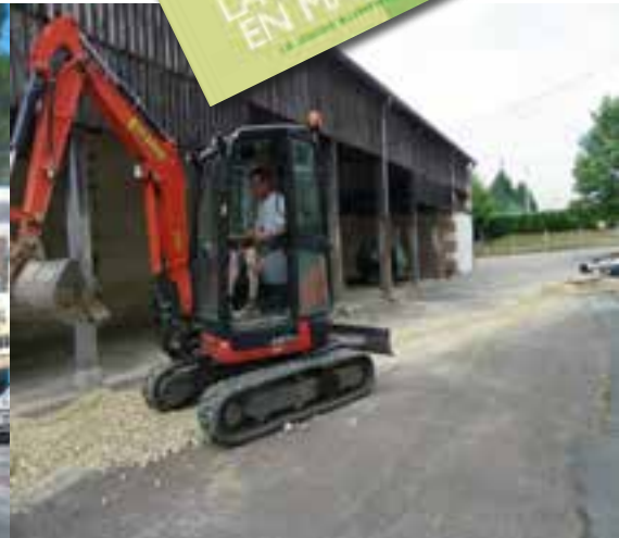
... la démolition de la cantine.