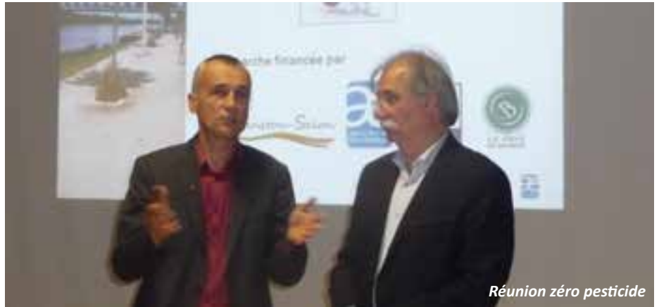
Réunion zéro pesticide